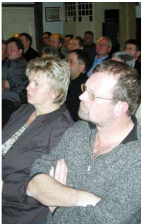
Der var stort fremmøde i Håndværkerhuset til orienteringsmødet om Aalborg Kommunes SMV-venlige udbuds- og indkøbspolitik